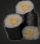
31 Tamago Maki Omelet (3st)