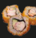
37 Ebi Maki Garnalen (3st)