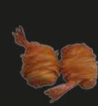
66 Ebi Iyagaimo Garnalen