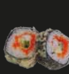
40 Deepfried Roll Gefrituurde Sushi (2st)