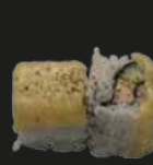
39 Cheese Roll Maki Kaas (2st)