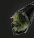
23 Wakame Zeewier Handrol