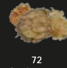
72 Yaksai Tempura Gefrituurde Groenten