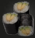
26 Avocado Maki Avocado (3st)