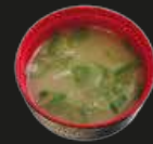
90 Miso Shiro Misosoep