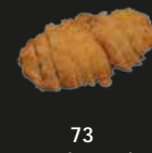
73 Tori Furai Gepaneerde Kip