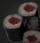
30 Tekka Maki Tonijn (3st)