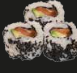
35 Wasabi Sake Zalm/Avocado