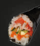
22 California Krab Handrol