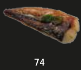
74 Saba Shioyaki Gegrilde Makreel