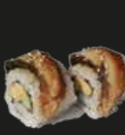
38 Unagi Maki Paling (2st)