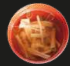
91 Osuimono Vis Soep