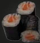
27 Sake Maki Zalm (3st)