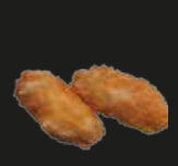
69 Teba Yaki Geb. Kipvleugels