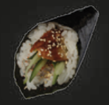
24 Unagi Paling