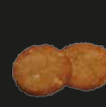
67 Potato Cheese Aardappelkoekjes