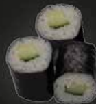
28 Kappa Maki Komkommer (3st)