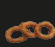
68 Ika Fried Gebakken Inktvis