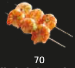
70 Grilled Shrimp Skewer Garnalen Spies