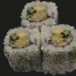
36 Crispy Roll Vegetarisch (3st)