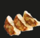
93 Gyoza Vleespasteitjes