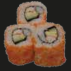
33 California Maki Krab/Avocado (3st)