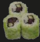
34 Spicy Tuna Pittige Tonijn (3st)