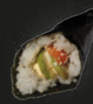
20 Sake Zalm