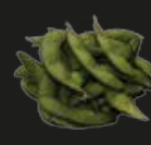
92 Edamame Sojabonen