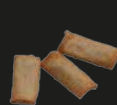
65 Haromaki Mini Loempia's