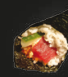
21 Tuna Tonijn